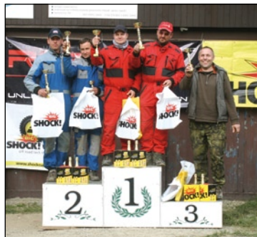
Stupně vítězů 5. závodu třídy O2