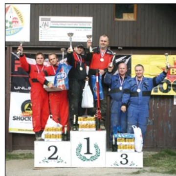
Mistři ČR za rok 2013 - třída O3