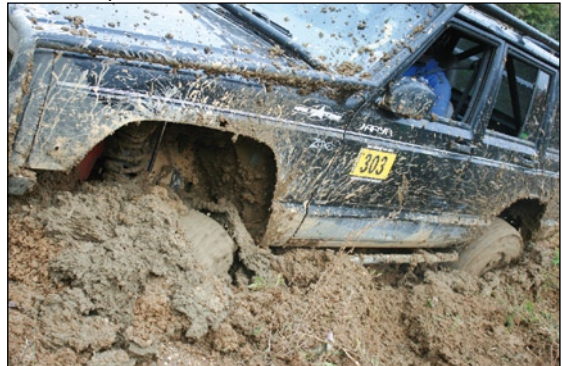
..., ale sekce č. 9 byla pro ně doslova blátivou pastí