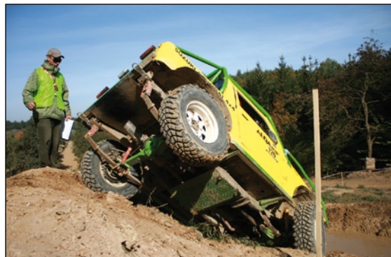
Aleš Svoboda jezdí s manželkou Lenkou (120) opravdu na hranici fyzikálních zákonů...