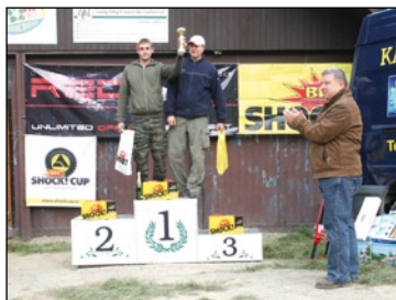
Stupně vítězů 5. závodu třídy O4