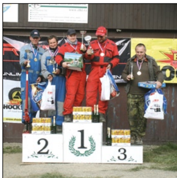
Mistři ČR za rok 2013 - třída O2