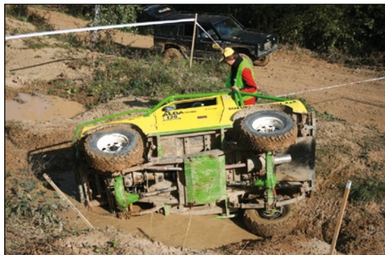
...no a někdy mu to nevyjde a manželku „vyklopí“