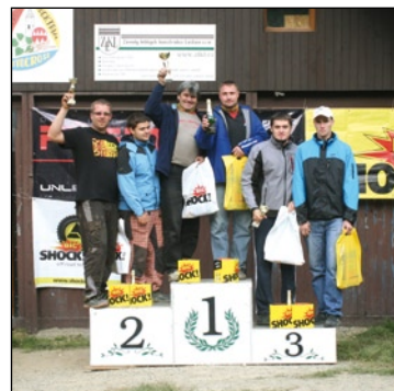
Stupně vítězů 5. závodu třídy O6