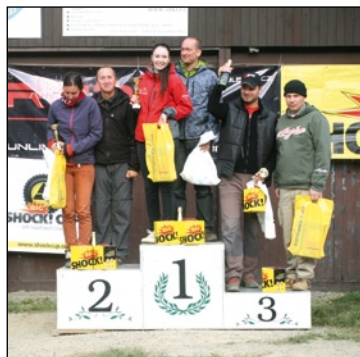
Stupně vítězů 5. závodu třídy O5