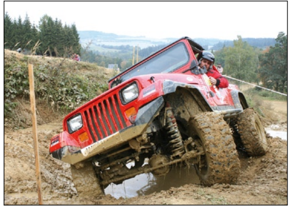
...a nakonec zůstali ve své třídě sami

ním komisařem – férově počkaly! I takové gesto hovoří o pohodových vztazích mezi posádkami seriálu.