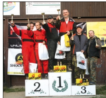
Stupně vítězů 5. závodu třídy O3