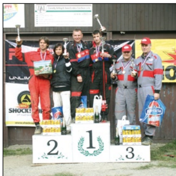
Mistři ČR za rok 2013 - třída O1