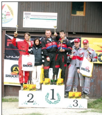
Stupně vítězů 5. závodu třídy O1

Pro posádky volných tříd připravili pořadatelé na sobotu méně náročný terén, u kterých byla v průběhu dne zvyšována obtížnost průjezdu brankových polí. V neděli na posádky volných tříd čekaly sekce v náročnějším terénu. Ale i ve volných třídách se urputně závodilo a také se bylo na co dívat. Poslední závod v Mohelnici byl pro volné třídy vrcholem. V příštím roce se ve volných třídách opět začne od jednodušších a nenáročných sekcí.