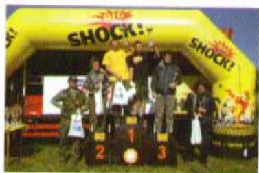
5. závod, stupně vítězů – O1