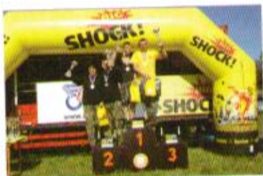
Konečné stupně vítězů, mistři ČR 2010 – O1

se týká i startujících posádek, které svými výkony udělaly ze seriálu náležité sportovní drama. V celkovém pořadí seriálu 2010 bylo klasifikováno 51 posádek. Na závěr můžeme konstatovat, že se třetí ročník seriálu vydařil. Více informací k pátému závodu a celému seriálu najdete na www.shockcup.cz .