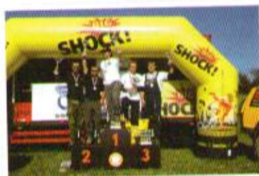
Konečné stupně vítězů, mistři ČR 2010 – O3