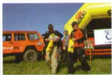
Předání ceny „Nováček roku“

Pro Off Road Revue J.P.