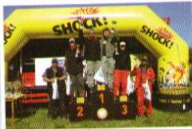
5. závod, stupně vítězů – O2