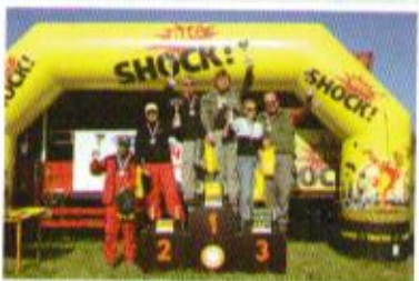
Konečné stupně vítězů, mistři ČR 2010 – O2

Pro Off Road Revue J.P.