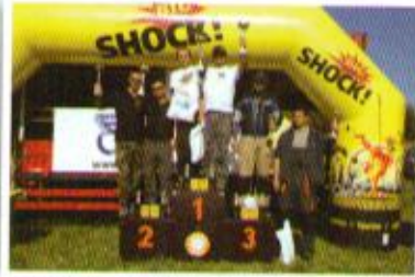
5. závod, stupně vítězů – O3

víkend, sportovním komisařům a všem partnerům závodu. Poděkování si samozřejmě zaslouží také všichni ti, kteří se podíleli na