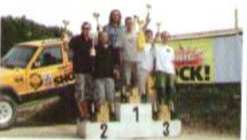
Vřesina - třída O3