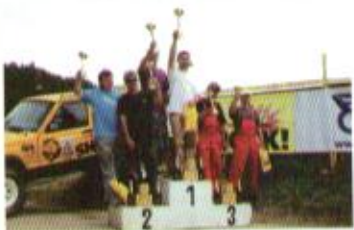
Vřesina - třída O2