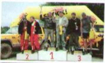
Bratronice - třída O2