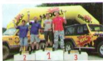
Bratronice - třída O1