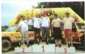
Bratronice - třída O3