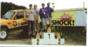
Vřesina - třída O1